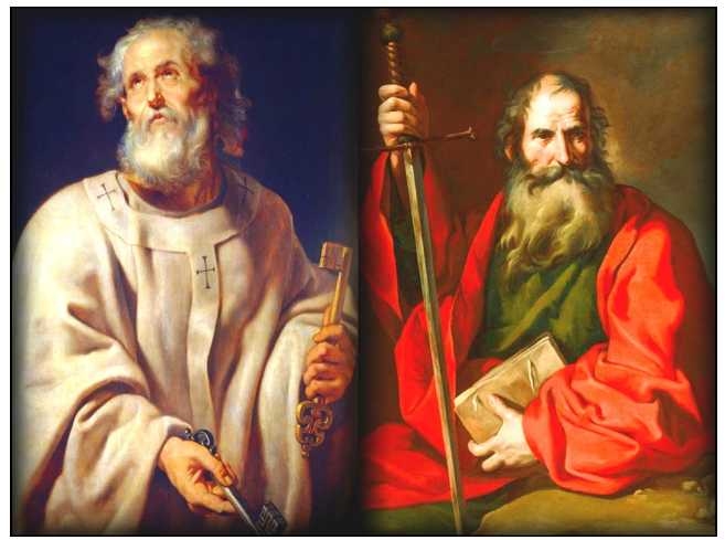
San Pedro y San Pablo, apóstoles ~ 29 de junio

Semana 1, del 19 al 25 de julio; Semana 2, del 26 de julio al 1 de agosto. Para niños que ingresaran a grados 6.º a 9.º. Becas disponibles. Para mayores informes comuníquese a través de info@v2ministries.org o 401-915-0482. www.v2ministries.org