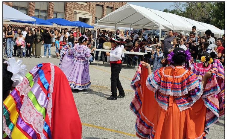
Bailarines folclóricos en la fiesta parroquial de Holy Name en 2025

Es necesario participar en una de nuestras clases de preparación, ya sea en español o en inglés, para programar un día y hora para un Bautismo en las Iglesias Holy Name o S. Philip Neri. La inscripción formal y participación en la parroquia son requisitos previos, y la inscripción es obligatoria para asistir a la clase. Por favor, comuníquese con la secretaria de su oficina parroquial, ya sea de la Iglesia Holy Name o de St. Philip Neri-Blessed Sacrament, para determinar las futuras clases y preinscribirse.