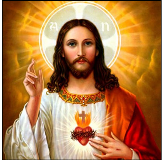
Junio ~ mes del Sagrado Corazón de Jesús

Sitios Web: CUESschools.org holynameschoolomaha.org