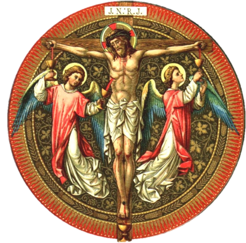
Julio ~ Mes del Preciosísima Sangre de Cristo

Anuncios para el boletín: Por favor, enviar los anuncios a través del correo electrónico meramm@archomaha.org o llamar a la oficina parroquial, extensión 721. Los anuncios deben entregarse a más tardar el martes. Gracias.