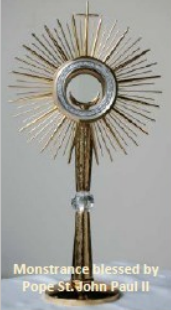
Monstrance blessed by Pope St. John Paul II