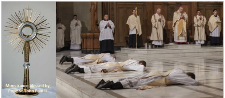
Monstrance blessed by Pope St. John Paul II

Teléfono 402-315-3500 spnschoolomaha.com