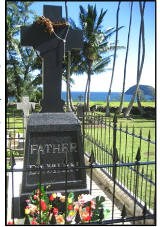
La tumba de San Damián de Molokai

homónimo y patrono: San Damián de Molokai. Tuve la oportunidad de asistir a su canonización en Roma el 11 de octubre de 2009. Al año siguiente viajé a Hawái y recibí un permiso especial para descender por los empinados y estrechos caminos en zigzag y visitar así Kalaupapa, la península en la isla de Molokai (Hawái) donde vivieron los leprosos exiliados y el propio San Damián. San Damián fue un misionero belga que contrajo la lepra mientras cuidaba de aquellos a quienes el mundo consideraba indignos de ser amados e incluso intocables. Entregó su vida movido por un amor heroico hacia los demás. ¿Quién es el leproso que se encuentra entre ustedes? ¿Hay alguien que les cause «repulsión»? ¿Sienten desprecio por alguna persona en particular? Que San Damián nos enseñe a amar y a reconocer que todos - incluidos nosotros mismos y nuestros enemigos - somos dignos de ser amados y de ser redimidos.